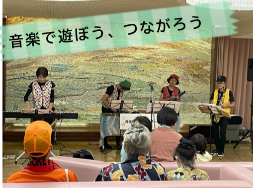
音楽で遊ぼう、つながろう