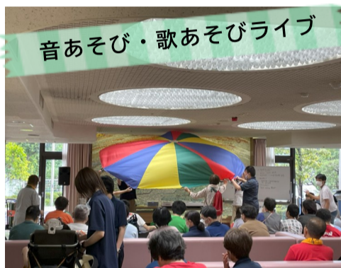
音あそび・歌あそびライブ